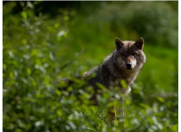
Un loup observé en Vaucluse - Ferus

Des individus solitaires y sont observés régulièrement.