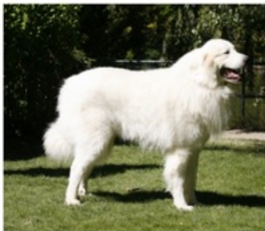
Montagne des Pyrénées

Ce sont des animaux de travail, ils veillent sur les troupeaux de manière autonome, analysent les situations et prennent seuls des décisions qui parfois peuvent être inattendues.